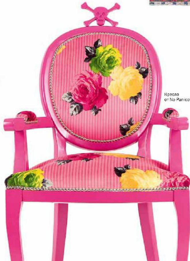
Кресло от No Panico!

В 21-е столетие человечество вступило хоть с легким опасением конца света, но и с расширенным глобализмом и антиглобализмом сознанием. Все эти политические «сужения» и объединения все-таки повысили эластичность наших представлений о человечности, и творческие силы вновь стали замечать великое в малом, обернувшись к локальным культурам, ремеслам, фольклорным техникам и впуская их, наконец, в мейнстрим моды и дизайна. И теперь это был уже не только богемный шик 70-х, а нечто более жизненное и для всех. Локальность, рукотворность, близость и теплота вдруг стали актуальными понятиями не только в рамках малой ячейки социума. Что-то важное вышло из общественного подсознания, отчего дизайн и мода сбросили клоунаские наряды и строгие костюмы, почти приоткрыв скрытую под ними человеческую красоту. А орнамент, искупив в изгнании свои преступления, продолжил шлести бесконечный узор истории. ☑