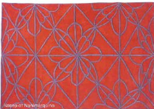
Ковер от Nanimerquina