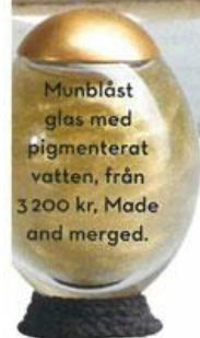
Munblåst glas med pigmenterat vatten, från 3 200 kr, Made and merged.

Arkitekten Giò Ponti var en begåvad mångsysslare, som ritade hus (bl a Italienska kulturinstitutet i Stockholm), porslin och möbler. Hans fint kurvade mässingsspeglar från 1933 finns nu i produktion genom Gubi för 9 595 kr resp 13 745 kr.